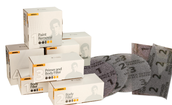
Discos ø 77 / Hojas 75 x100