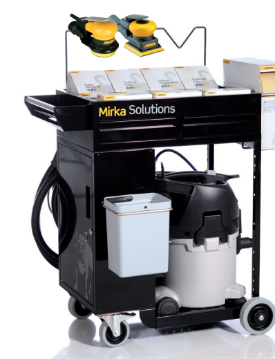
Trolley Mirka Solutions