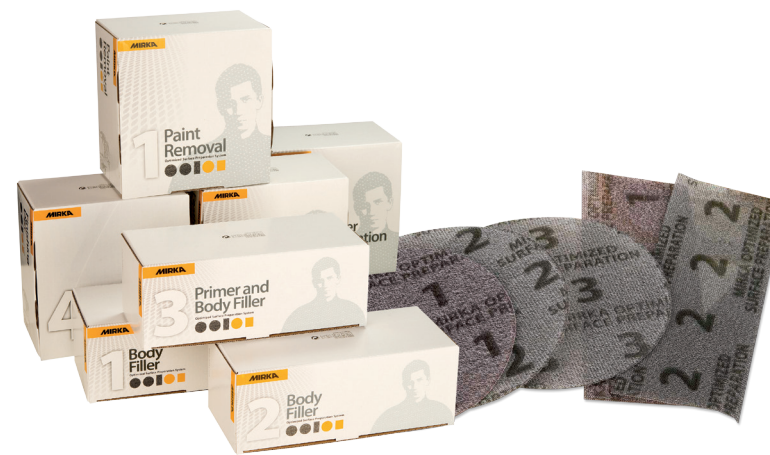
Discos ø 150 / Hojas 75 x198