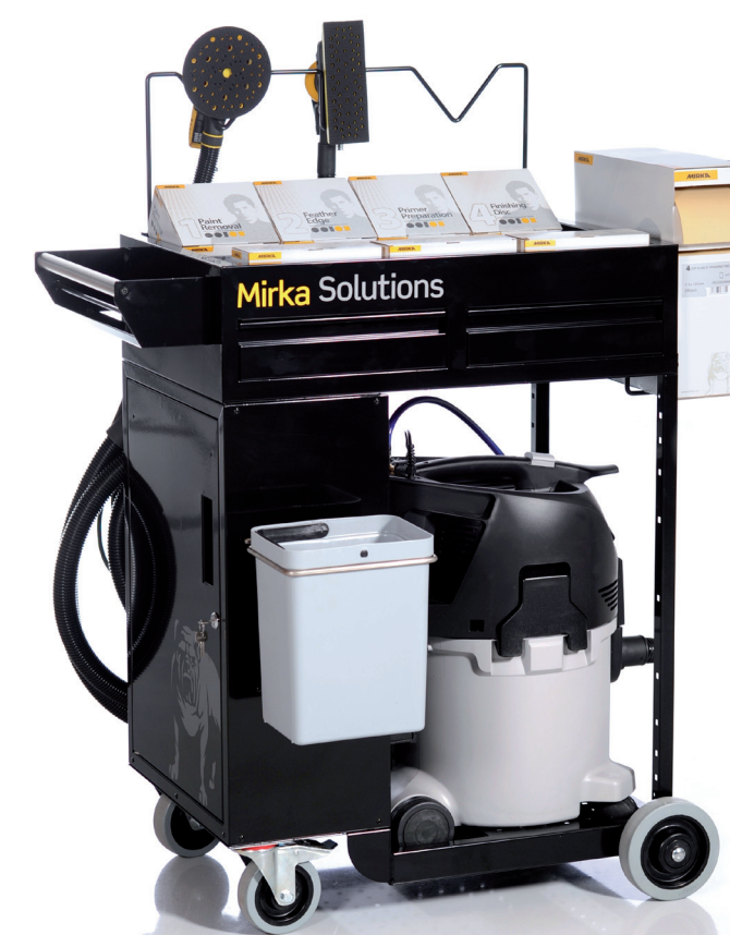
Trolley Mirka Solutions